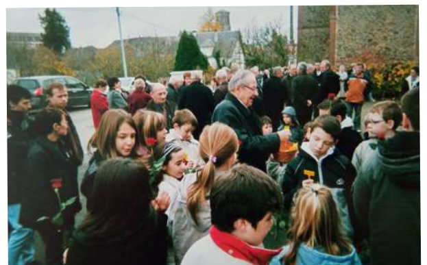
11 Novembre 2008 : Commémoration Armistice 1918.