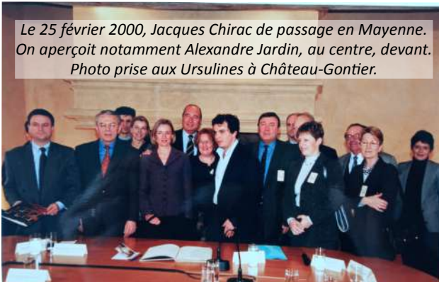
Le 25 février 2000, Jacques Chirac de passage en Mayenne. On aperçoit notamment Alexandre Jardin, au centre, devant. Photo prise aux Ursulines à Château-Gontier.