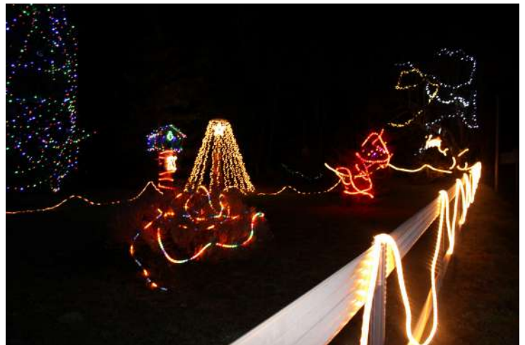
Vous avez été encore très nombreux cette année à embellir vos extérieurs pour le plaisir des yeux. Soyez-en remerciés. (Ci-dessus, la maison d'hôtes de La Lavandière)

Une réflexion collective devra être menée pour imaginer quel visage nous souhaitons donner à notre village dans les prochaines années (aménagement du centre bourg, liaison douce, énergies renouvelables, habitat, accès au numérique...). Nous voulons rester humbles et à l'écoute de vos idées car conscients que c'est avec votre expertise, votre imagination et notre force collective que nous construirons La Chapelle au Riboul de demain.