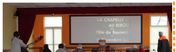
Séance d'enregistrement à la salle des fêtes